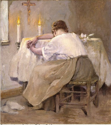
Son premier enfant, par Robert Reid