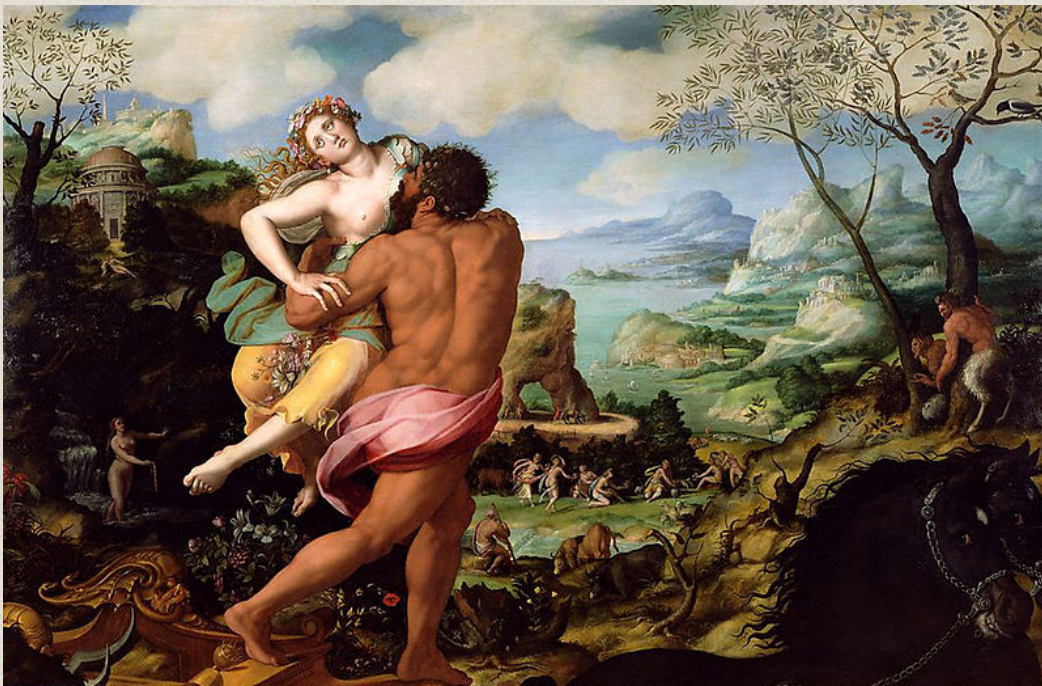
Le rapt de Proserpine, par Alessandro Allori

Le plan est parfait, divin même et donc rien ne se passe comme prévu.