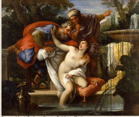
Suzanne et les vieillards, par Giuseppe Bartolomeo Chiari