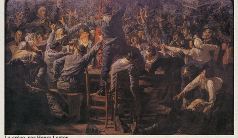
La grève, par Henry Luyten