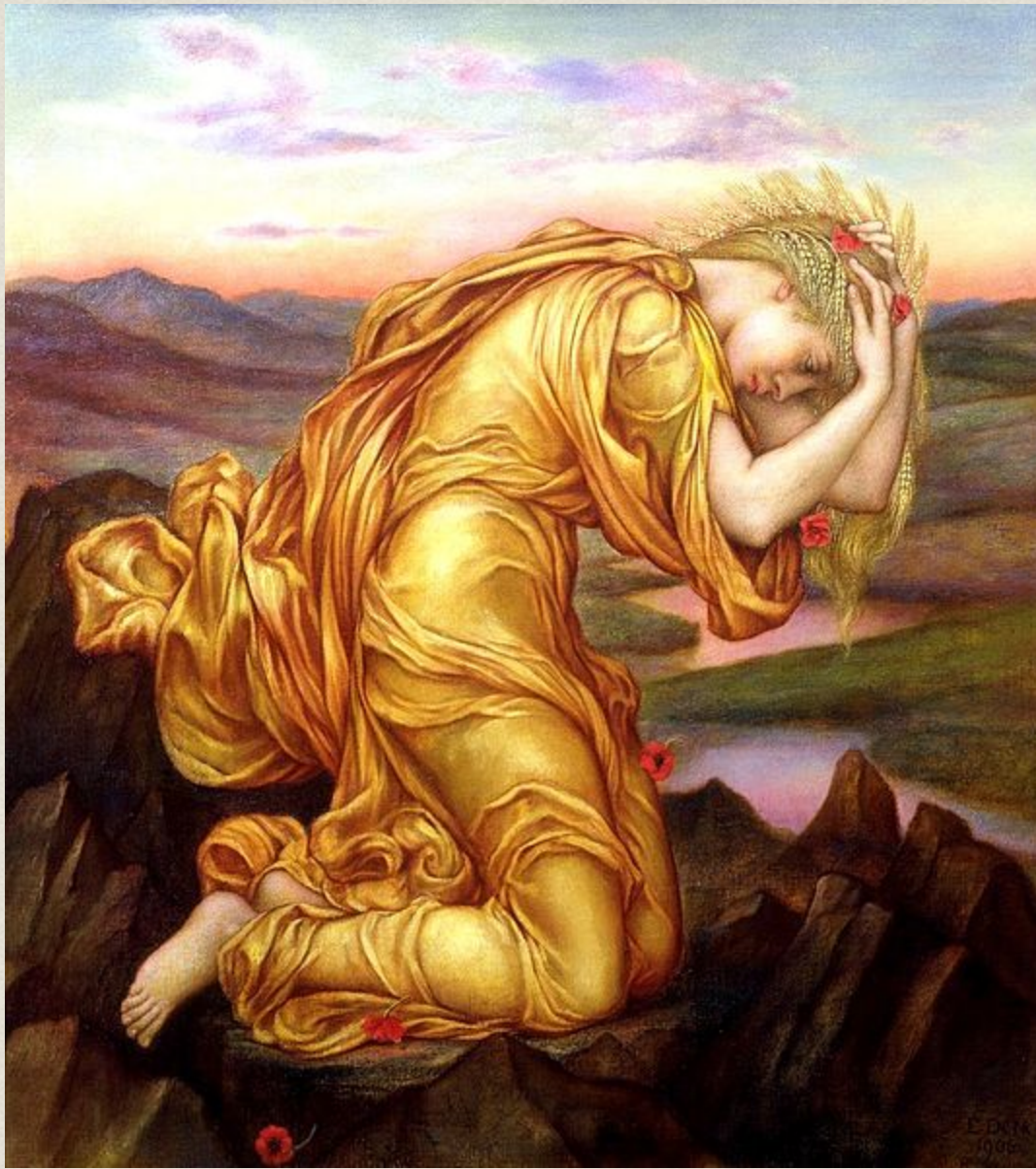
Déméter pleurant Perséphone, par Evelyn de Morgan

À celle qui a grandi sous le soleil de Sicile, dans l'odeur fraîche et vigoureuse des citronniers, l'absence de lumière est insupportable, comme celle de sa mère, comme celle de la vie. Et puis, elle est si jeune, et il n'y a que des vieux décrépits autour d'elle. Même les défunts les plus verts lui parlent de gens qu'elle n'a jamais connus. Quelle lassitude ! Quelle désolation ! Elle pleure, elle soupire, dépérit parmi les âmes, se meurt parmi les morts sans pouvoir mourir. Le pire vient lorsque de son palais, elle entend au-dessus d'elle les pleurs rauques de sa mère, Déméter, la déesse qui veille aux récoltes. Tout à son chagrin, elle n'a que faire des semailles si bien que sur Terre plus rien ne pousse. Au bout de quelque temps de ce traitement le monde d'en-haut, celui des vivants, ressemble de plus en plus à celui des morts. Sous le soleil et sous la terre, tous et toutes se lamentent.