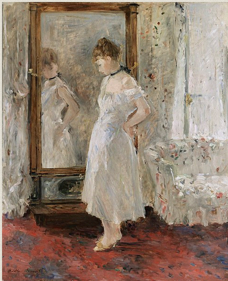
Berthe Morisot, La psyché , 1876

D'ordinaire, dans la mythologie, voir un dieu dans sa réelle apparence, « en majesté » provoque la mort extatique et subite. Mais pas pour l'extraordinaire Psyché qui supporte avec délice ce qui provoquerait la mort de n'importe quel mortel. Jusqu'à ce qu'une goutte d'huile bouillante ne tombe de la lampe et ne réveille le dieu qui s'envole d'un battement d'aile. Là encore, même si toute la tradition, bercée par des représentations plus contemporaines, nous inviterait à voir dans Psyché l'archétype de la faible femme abandonnée se lamentant sur sa funeste destinée, il faut bien souligner que, dans le texte d'Apulée, Psyché, loin d'accepter en victime son triste sort, prend son destin à bras le corps et s'agrippe à Cupidon jusqu'au bout de ses forces. Lorsqu'il n'est plus humainement soutenable de suivre avec le corps, Psyché suit du regard son Amour aussi longtemps qu'elle y parvient et, lorsque plus rien n'est possible même à une âme si forte, Psyché ne fait ni une, ni deux, elle se jette la tête la première dans le fleuve avoisinant. Ce n'est pas le moindre preuve d'amour ni d'audace que d'avoir la force d'un tel geste.